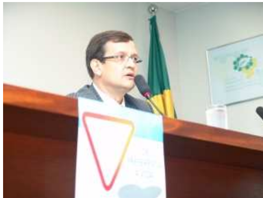
Legenda da Foto em anexo: Presidente da Frente, Beto Albuquerque fala sobre propostas que combatem motoristas alcoolizados

Para o presidente da Frente Parlamentar em Defesa do Trânsito Seguro, o projeto de conversão da MP nº 415 pode ser o meio para acabar com a impunidade de motoristas embriagados que cometem crimes na direção de veículos. Para Beto Albuquerque, presidente da Frente, "atacar a impunidade que reina para os que bebem e dirigem é a oportunidade do momento e anseio de toda a sociedade". Segundo o deputado "temos que ir direto ao principal protagonista das tragédias. A hora é de não achar nos outros as explicações para a irresponsabilidade do motorista que bebe e dirige".